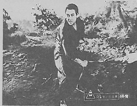
鶴田浩二・高倉 健