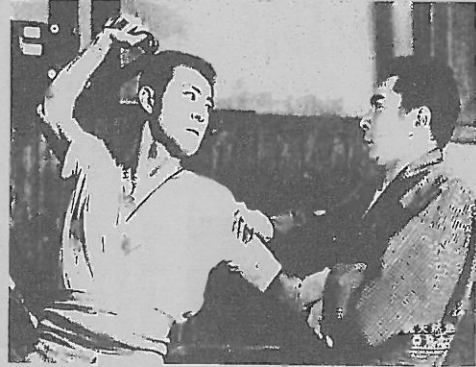
勝新太郎・田宮二郎