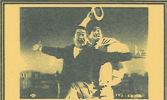
④あゝ軍歌 (1970年/日本/88分)

戦没者をまつる神社へ遺族を案内する怪しげな観光ガイドとして暮らしている二人の男のもとへ少女やヒッピー風の男等が迷い込んでくる奇妙な生活を描いた作品。前田陽一監督の代表作である。