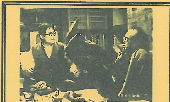
①喜劇・大安旅行 (1968年/日本/94分)

新婚カップルのあふれる和歌山県の紀勢本線沿線を舞台に、蒸気機関車の機関士と専務車掌という「鉄道一筋」の父子の恋愛騒動を描いた松竹喜劇の第1作。