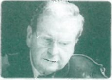
ウルリッヒ・コッホ(ヴィオラ)