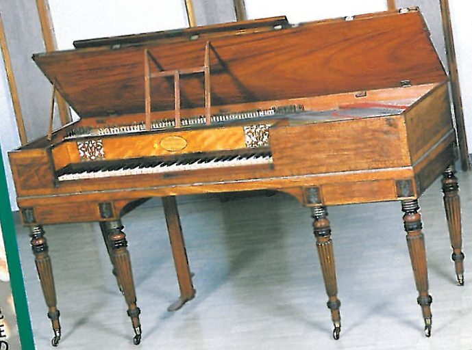
▲Stodart # 346 1812年

●チェンバロからフォルテピアノへそして現在のピアノにいたる鍵盤楽器の変遷を実際に使われていた楽器で演奏する解説付きコンサートです。2日間にわたり12台のピアノ(二部レプリカ含む)とチェンバロで当時の響きを再現します。パツハモーツァルト、ベートーヴェン、ショパン、リストの時代の音楽の旅へお出かけください。